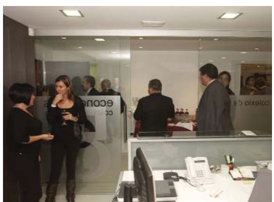
Dos momentos de la vista de los colegiados

Seguidamente fueron muchos los colegiados que fueron desfilando a lo largo de la tarde, que se mos-