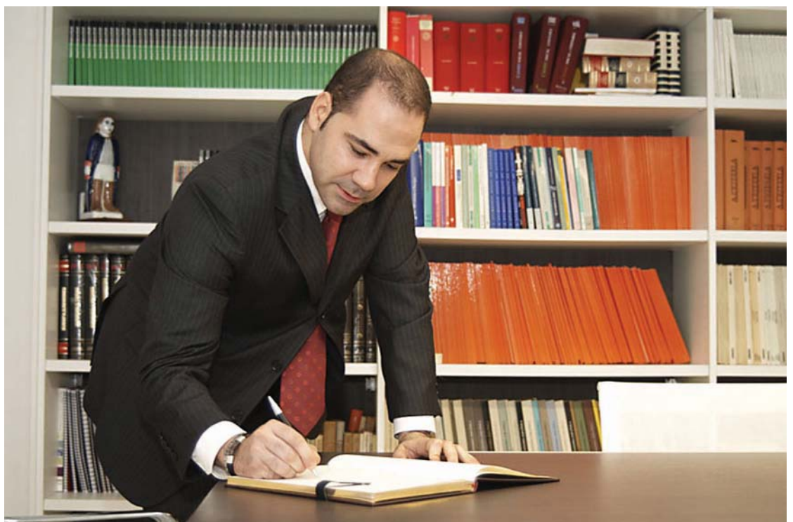
Las firmas y los comentarios se sucedieron en el Libro de Visitas

Para concluir la jornada, se ofreció un vino gallego a todos los asistentes que degustaron entre animados comentarios y felicitaciones por las nuevas instalaciones que a partir de ahora todos los colegiados podréis disfrutar.