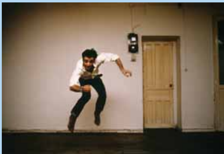
Obra de Alberto García-Alix que se puede ver en la exposición

Las obras expuestas en Ferrol, divididas en cuatro