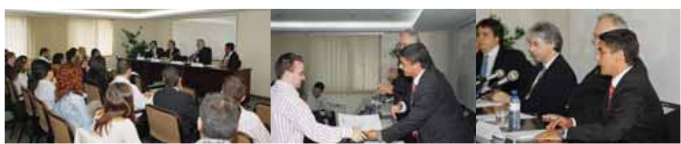
Instantáneas de la entrega de diplomas de una de las ediciones anteriores

tituto de Contabilidad y Auditoría de Cuentas), por lo que su superación es el primer paso indispensable para el acceso a la profesión de la Auditoría, acceso regulado por Ley; y, por otro, el excelente funcionamiento de su bolsa de trabajo que en las últimas ediciones ha supuesto la colocación del 100% de los alumnos desempleados casi de modo inmediato.