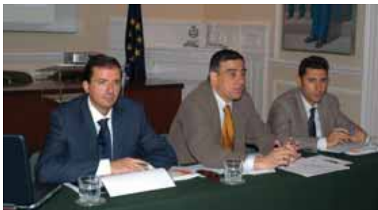
Una de las reuniones del Consejo Directivo del REAF

A este respecto el Ministerio de Economía está ultimando el desarrollo reglamentario de las obliga-