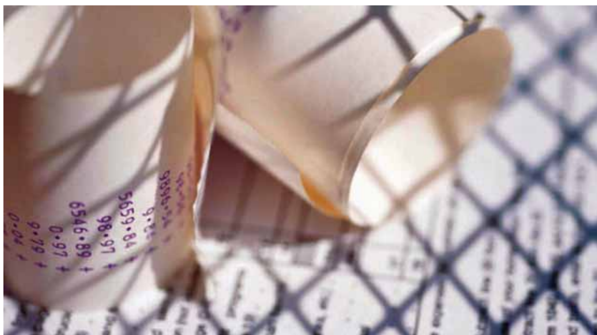
Impuesto sobre Sociedades